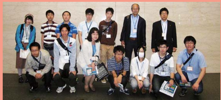
第24回学生選書モニター参加者

6月20日(土)にジュンク堂書店大阪本店にて学生選書モニターを実施しました。選書冊数は全1,323冊。その中から、既に図書館で所蔵しているものなどを除いた761冊を受け入れました。選ばれた本は学生選書図書コーナーに配架中。図書リストのファイルもありますので、ぜひご活用ください。