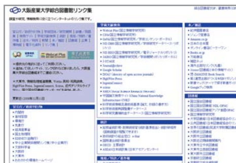
大阪産業大学総合図書館リンク集

最近の統計などの新しい情報はインターネットが便利。学内のパソコンからは、有料のデータベースも使えます。総合図書館のリンク集では調べものに便利なサイトをご紹介します。