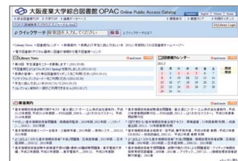
大阪産業大学総合図書館OPAC

総合図書館OPACを使えば、総合図書館にある本や雑誌を探せます。インターネットや携帯電話を使ってどこからでも利用可能。